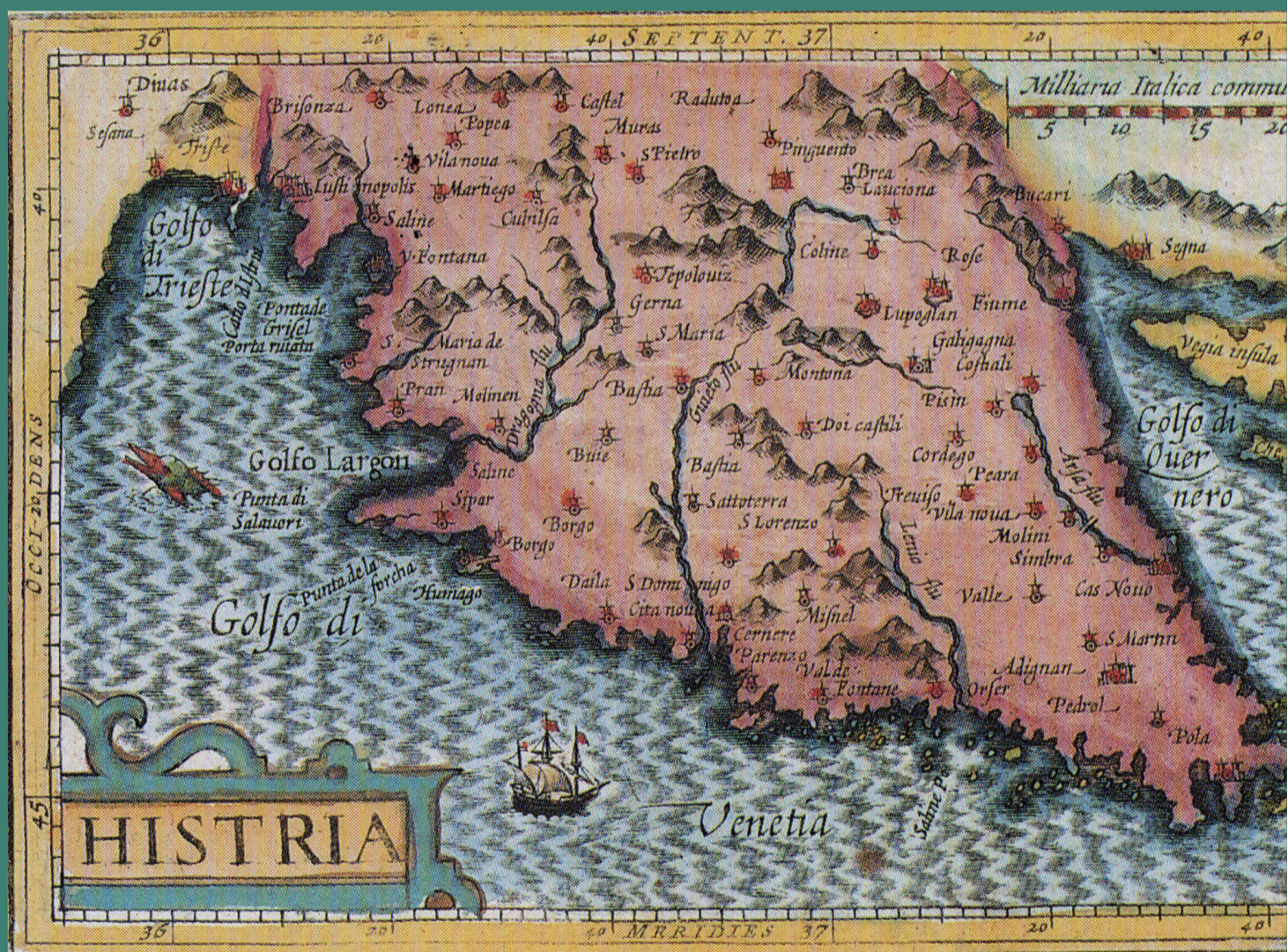
Paul van Merle o Paulus Merula. L'Histria nella "Cosmografia generale" (1605).